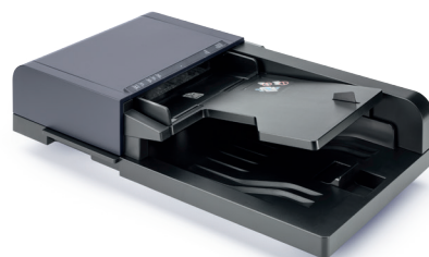
DOKUMENTMATARE DP-5100 Dokumentmatare för 75 ark. Vänder på dubbelsidiga dokument automatiskt.